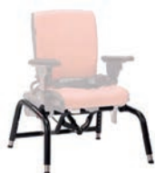
Base con basculación