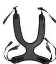
Peto de fijación estrecho