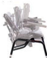
Base con basculación y asiento dinámico