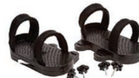
Par de sandalias