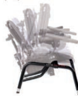
Base con basculación y asiento dinámico