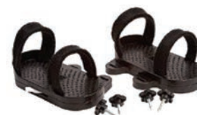
Par de sandalias