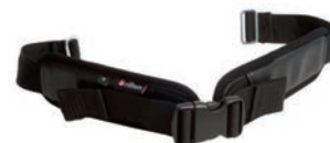
Cinturón de pierna