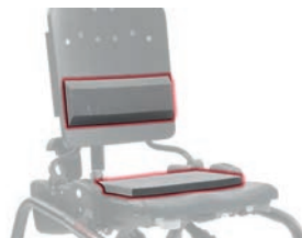
Kit soporte lumbar y asiento