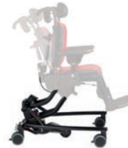
Base Hi-Lo con basculación y ruedas