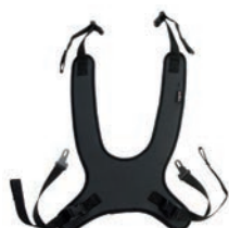
Peto de fijación estándar