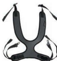
Peto de fijación estrecho