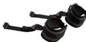
Par de bandas de tobillos