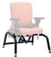
Base con basculación