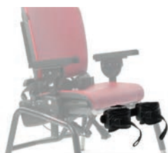
Soporte de piernas