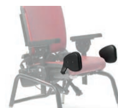
Par de adductores