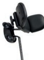
Reposacabezas con alas ajustables